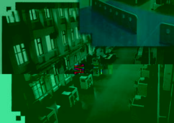
DMG 数控技术 训练场所